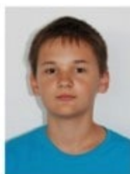
Прядкин Сергей (