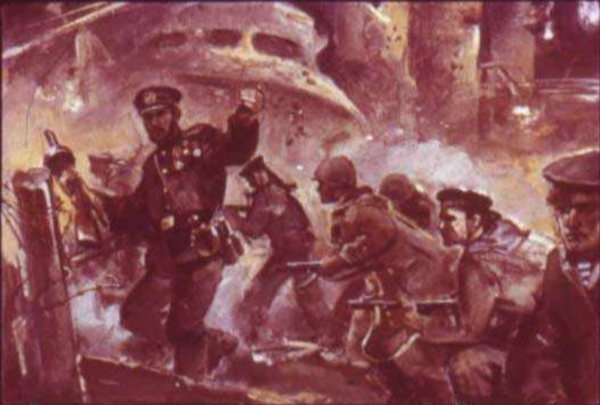
Роту отважных автоматчиков повёл на штурм Новороссийска Герой Советского Союза капитан-лейтенант Райкунов. [40]