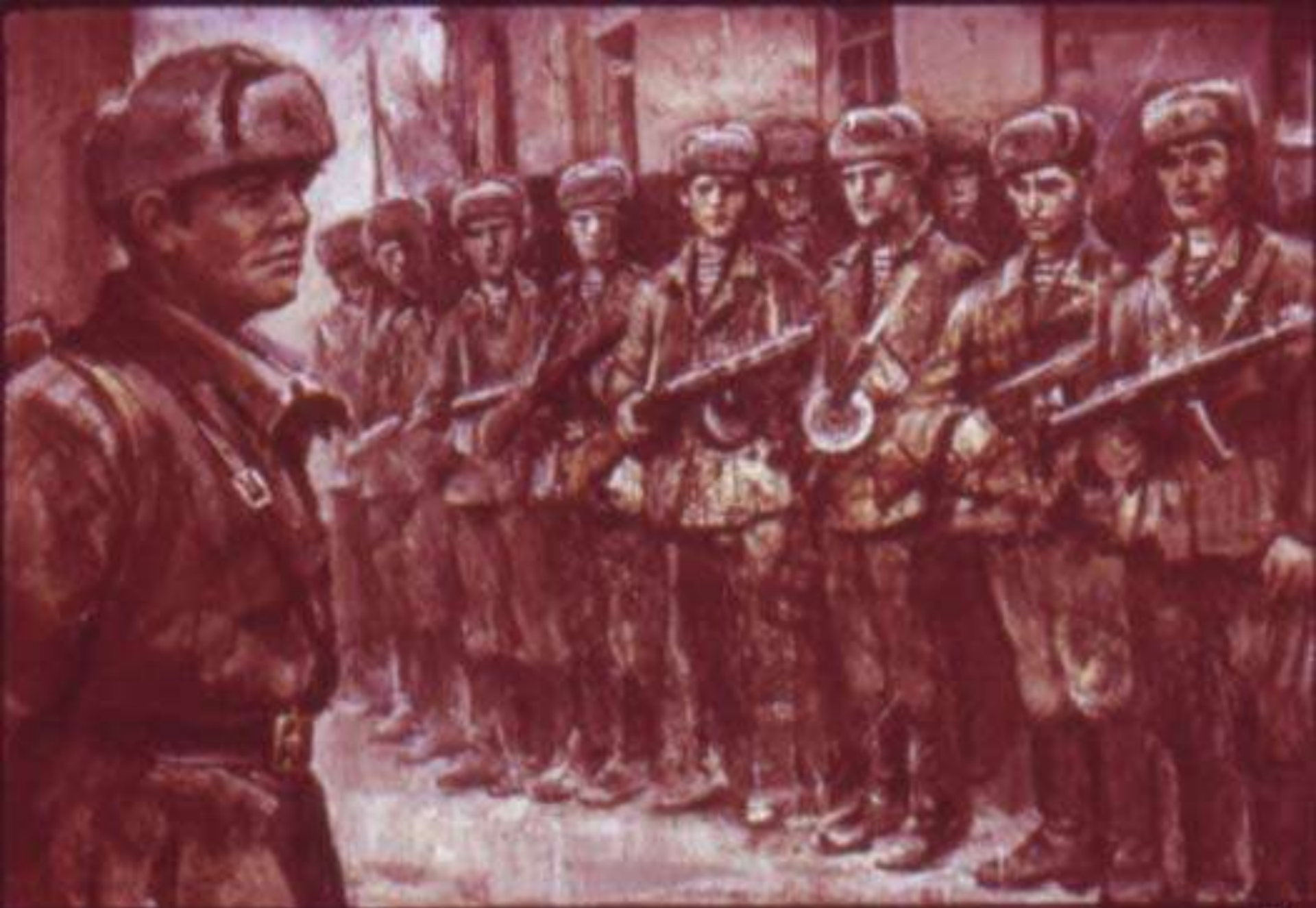
В десант пошёл весь отряд.